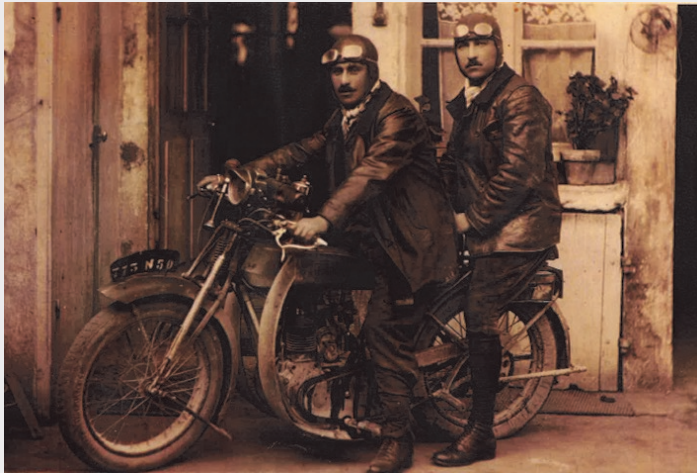
Les contremaîtres chargés des travaux en visite à Saint Bonnet.