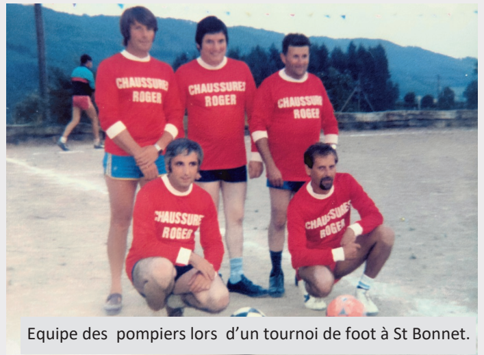
Equipe des pompiers lors d'un tournoi de foot à St Bonnet.

La cloche de l'église a donné l'alerte jusqu'en 1972. Ensuite, les alertes arrivaient à la Mairie, ou chez le caporal Dumontet. L'automatique 18 était reçu par le centre de secours de Lamure ou au domicile du chef de corps.